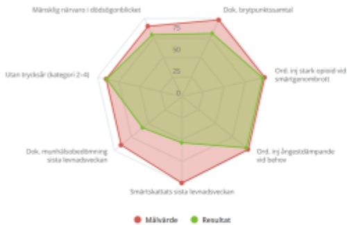
Spindeldiagram över kvalitetsindikatorer Period 2019-01 - 2019-12