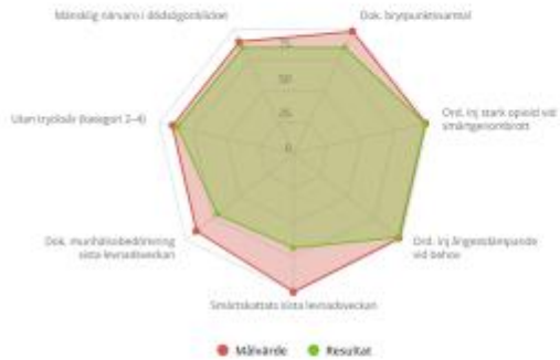
Spindeldiagram över kvalitetsindikatorer Period 2020-01 - 2020-12