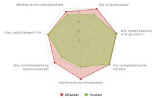
Spindeldiagram över kvalitetsindikatorer Period 2019-01 - 2019-12